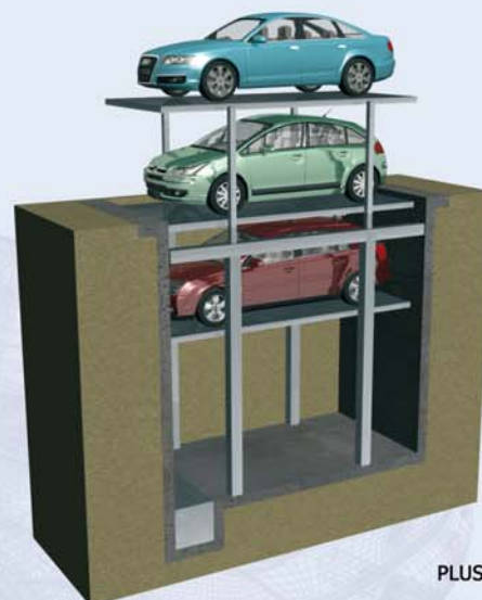
PLUSPARK 3 HIDE